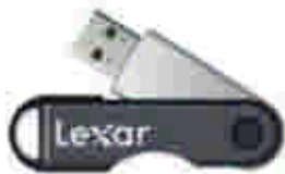
Lexar JumpDriver ® TwistDrive 16 Go

Description: Ensemble de 40 clés USB 2.0 de modèle DataTraveler Special Edition 9 de Kingston; 1 clé USB Lexar JumpDrive ® Twist Turn de 16 Go, concentrateur USB à 42 ports, adaptateur secteur, câbles